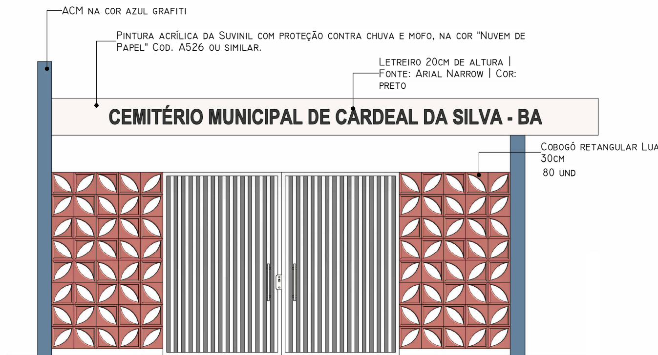
4 ENTRADA - FACHADA FRONTAL 1 : 50